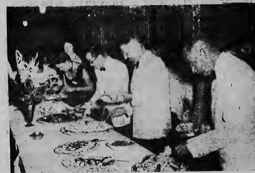
Omstreeks elf uur stond het rijk voorzien en meesterlijk gearrangeerd buffet in het middelpunt van de belangstelling.

OSTAD. — Het Comité Contact Burgerij-Militairen heeft besloten het jaarlijks Kerstfeest voor de mariniers op Maandag, 27 December, te houden in de marinierskazerne te Savaneta.